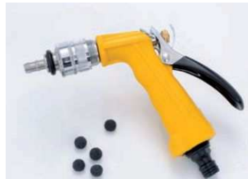
Пистолет за почистване на маркучите.

Полуавтоматичната система за почистване е много ефективна и се управлява лесно. След натискане на един бутон имате на разположение гореща вода. Откритият хранителен контейнер, който се регулира на височина е лесно достъпен и може да се контролира по всяко време. Можете лесно да отстраните утайките от маркучите на бибероните и от по-дългите маркучи с помощта на почистващия пистолет.