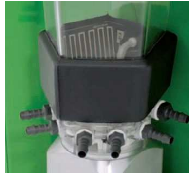
Нагревател за миксера (опция).

Нагревателят е оборудван с температурен сензор, терморегулатор и индикатор за минимална температура, което гарантира както поддържането на оптимална температура на млекозаместителя, така и лесна проверка и настройване на желаната температура, по всяко време.