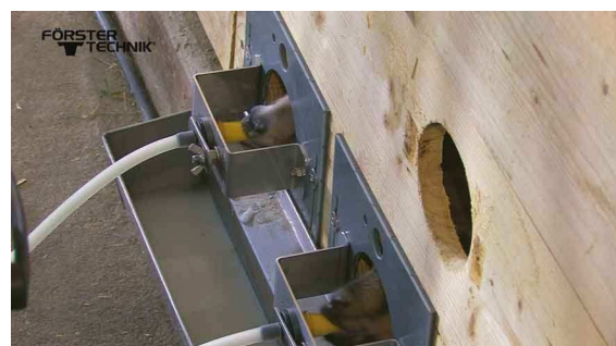
Големи ярета бозаещи от биберон монтиран на задната скоба.