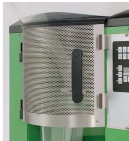
Защита против мухи (опция).

Фина мрежа, в предната част на хранителния контейнер, го предпазва от мухи. Парата формирана в хранителния контейнер се разсейва без образуване на конденз.