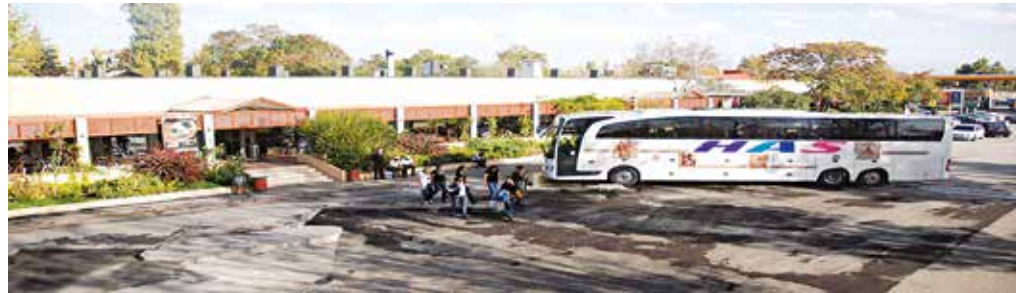
Фирми Агачли Ağaçlı Facilities