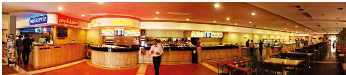
Хотел Мелендиз Hotel Melendiz