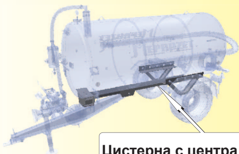
Цистерна с централна рама