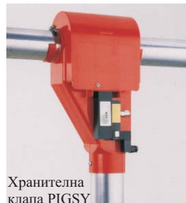
Хранителна клапа PIGSY

Най-напред в технологично отношение е хранителната клапа PIGSY. Тя е оборудвана с пневматичен механизъм с двойно действие и вградена електронно управляема клапа. Това позволява храненето да бъде управлявано изцяло електронно. Клапата PIGSY осигурява многофазово компютърно уп-