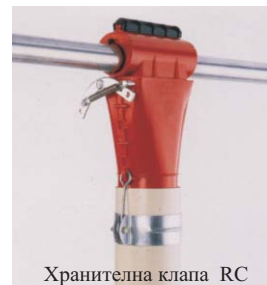
Хранителна клапа RC

и прецизен контрол. В следствие на базата на клапите MF, след въвеждането на нови хоризонтални шибри бе създадена системата "Multi-phase" за модер-