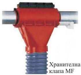
Хранителна клапа MF

Хранителните клапи MF са създадени за хранене на воля. Те са изработени от висококачествена пластмаса, имат голям отвор и хоризонтално разположен шибър, което позволява пълно освобождаване на фуража