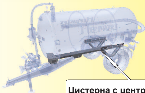
Цистерна с централна рама